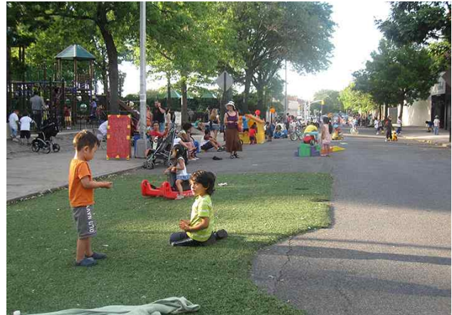
Green Streets(New York)