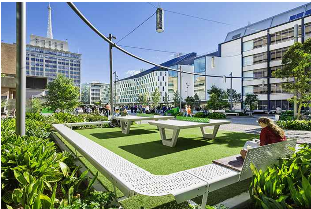
UTS City Campus(Australia)