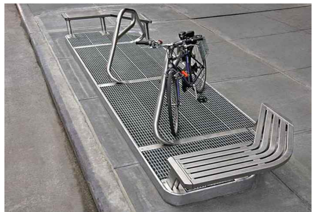
Bus and Bicycle Parking Shelters(New York)