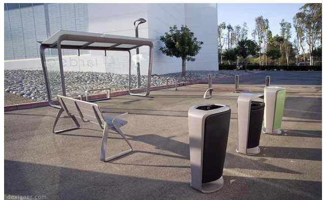
Street Furniture in Madison, Wisconsin(America)