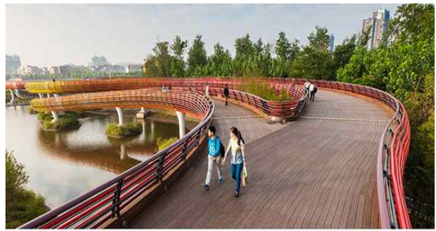
Jinhua City, Zhejiang Province(China)