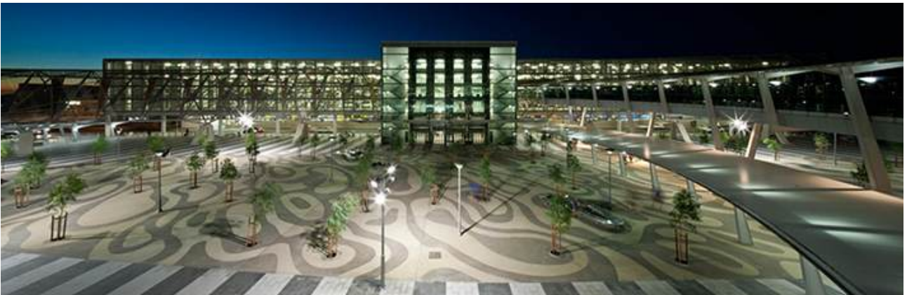
pocket park in Adelaide Airport(Australia)