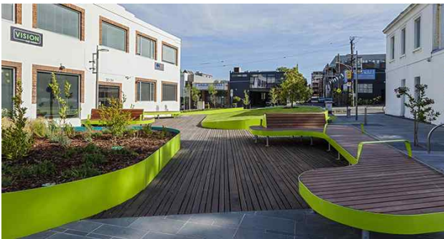
oxford street collingwood(Australia)