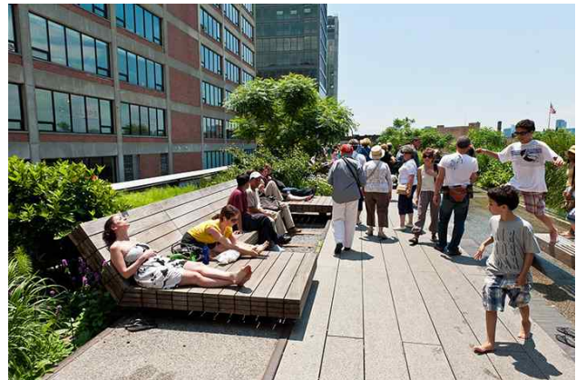
High Line park(New York)