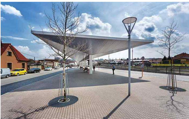
Shelters in Zaragoza(Spain)