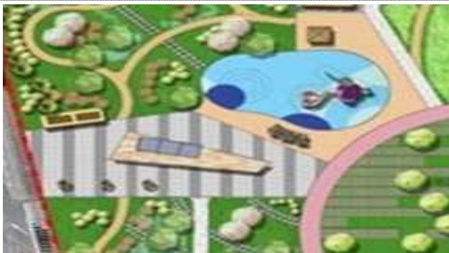
상세 위치 평면도