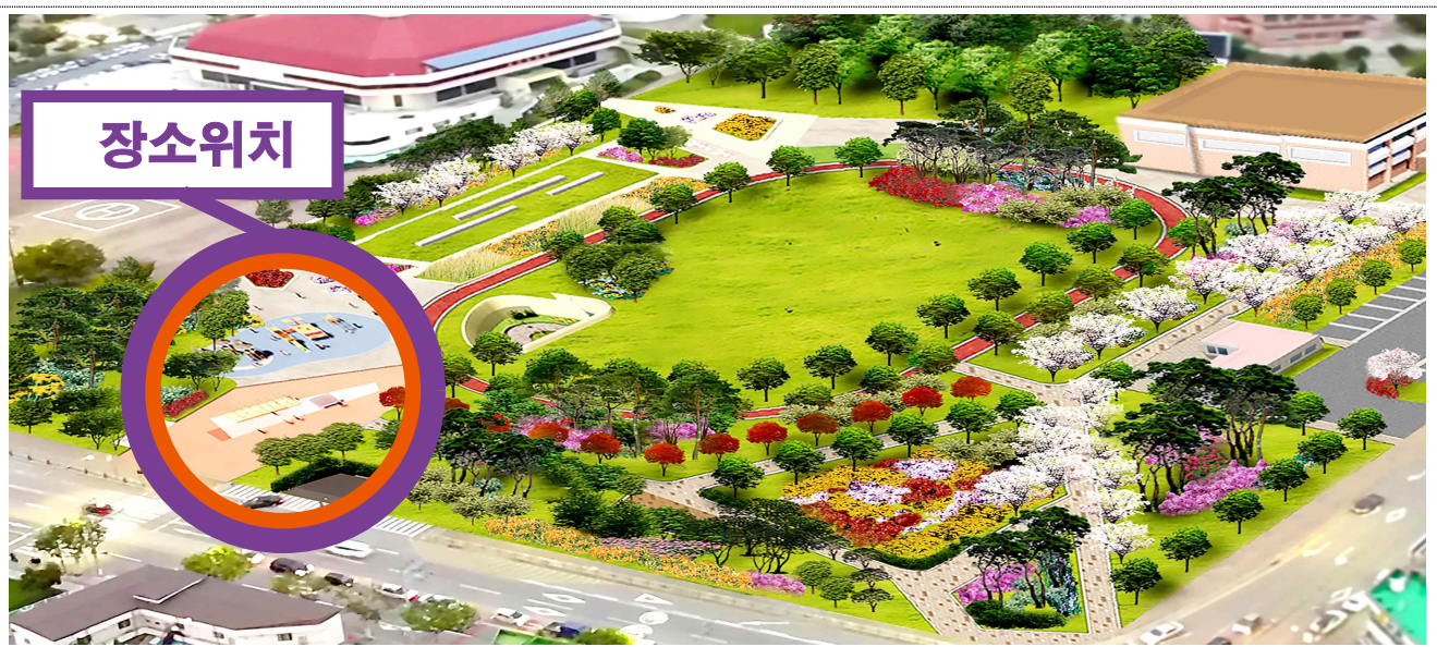
(구)충주공설운동장 공원 조성 계획 조감도